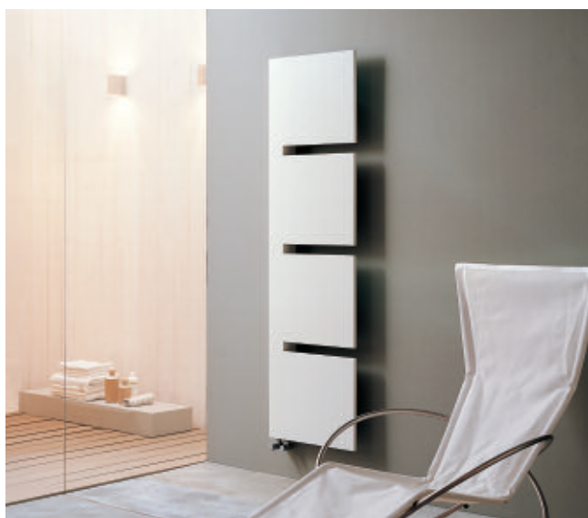
Sequenze L vopsit în culoarea Alb Perla (cod. 16).

Formele deosebite capătă o nouă funcționalitate, devin tridimensionale și sculpturale. Luminile și umbrele relevă o spiritualitate intrinsecă a obiectului.