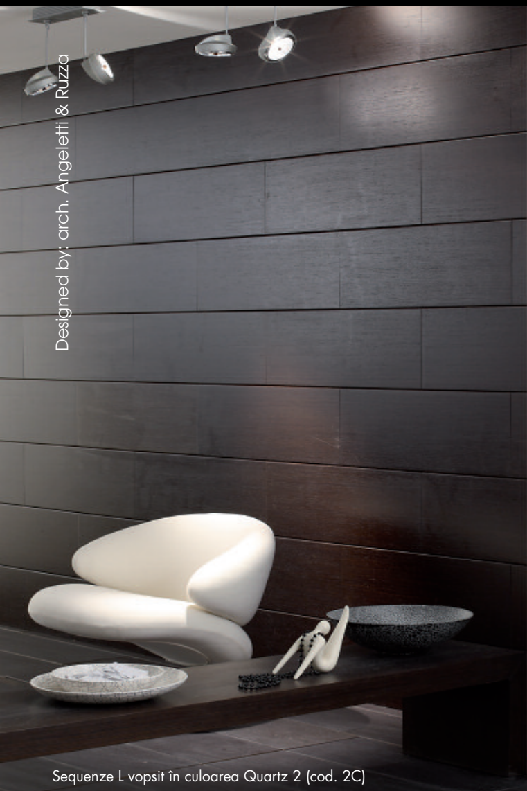
Sequenze L vopsit în culoarea Quartz 2 (cod. 2C)