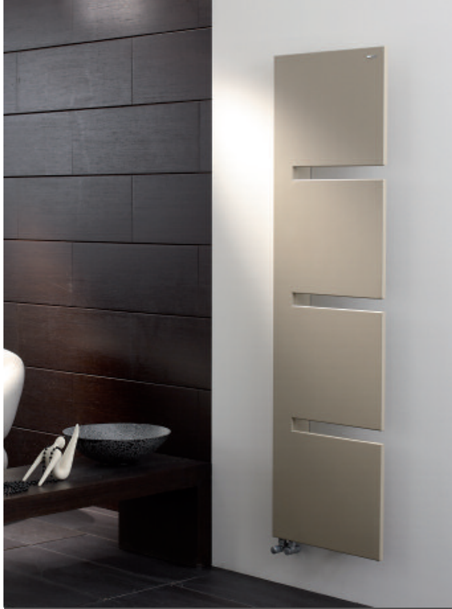
În fotografie: Calorifer Sequenze L. Înălțime mm 1735, lățime mm 500, culoare Quartz 2 (cod. 2C).