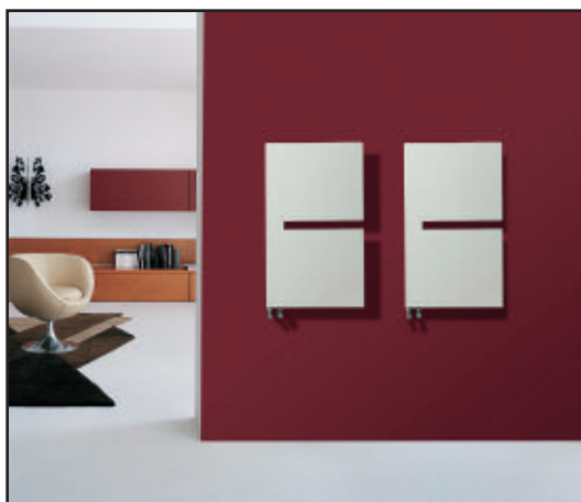
În fotografie: Calorifer cu dublă culoare Alb Perlă (cod. 16).

Randamentul este calculat în fază de certificare. Putere calculată cu Δt 60°C • Pentru Δt ≠ de 60°C utilizați formula: Q=Q_n (\Delta t / 60)^n